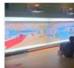
Aula delle meraviglie