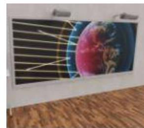
Server medio e 3 anni

Doppia parete con 2 proiettori interattivi, lavagne, impianto audio e media server dedicato al funzionamento della parete. I proiettori possono essere utilizzati in coppia, creando una superficie superiore ai 160 pollici collegata al media server Windows o anche singolarmente con applicazioni diverse. La fornitura prevede un media server base adatto all'utilizzo di webapp e applicativi didattici (I5 - 16gb - 500gb - Scheda Video 4gb). Inclusa licenza software didattico Mozaik di 3 anni e supporto tecnico dedicato di 3 anni. INCLUSA INSTALLAZIONE su parete sgombra in muratura standard.